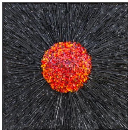
La Planète Feu