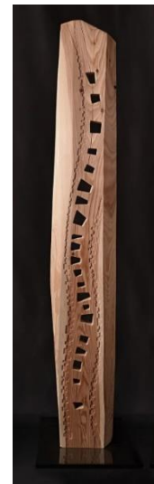
Ligne d'eau III