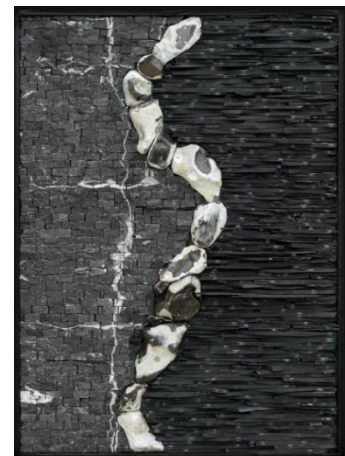
Jeu de Lumière