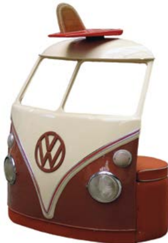
VW. Banquette Split. France. Thierry Courtade, 2008 SurfingMemory, coll. Gérard Decoster

Une série de présentations est proposée autour des thèmes du jeu, du sport, de la contre-culture, de l'émancipation féminine et de la relation à l'environnement.