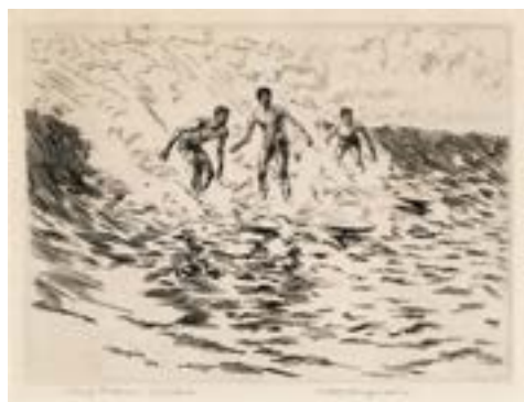
Surf riders at Waikiki. Huc-Mazelet Luquiens. 1918 SurfingMemory, coll. Gérard Decoster