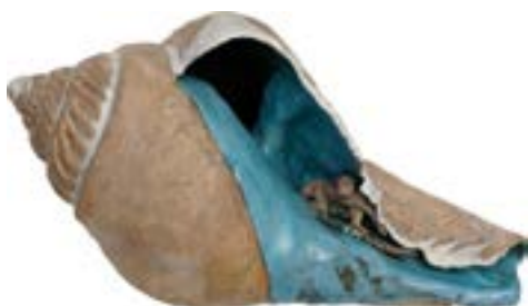
Surfer in a sea shell. USA. Céramique. Mark Bell. 1985 Surfing Memory, coll. Gérard Decoster