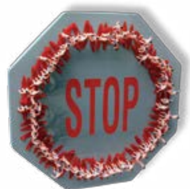
Stop. France. Gérard Decoster SurfingMemory, coll. Gérard Decoster