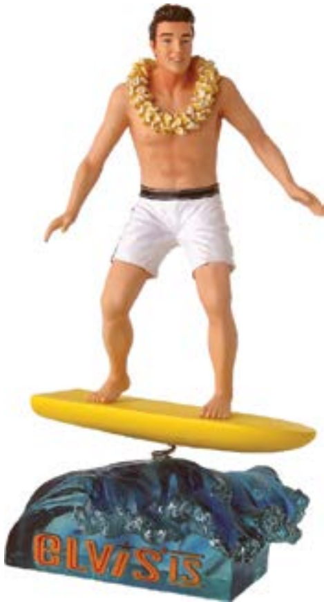
Elvis is... Westland. Figurine de tableau de bord SurfingMemory, coll. Gérard Decoster