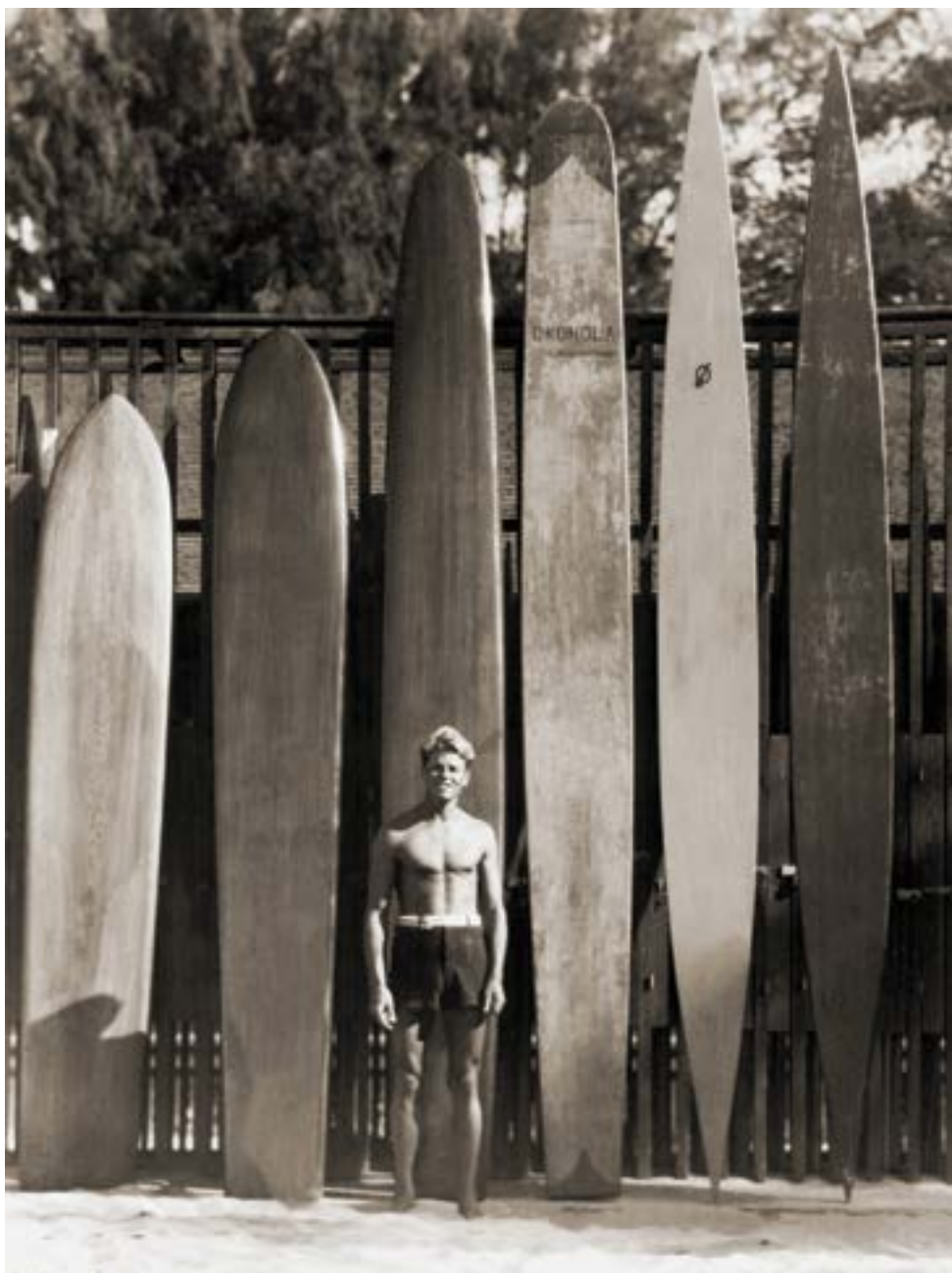
Tom Blake, Honolulu, Hawaii 1929-30, avec son quiver de planches « plank », « olo », et « hollow ».

Différents marqueurs sont évoqués ici : la vague, le spot, le langage, les haut-lieux... et surtout les planches, au travers de la collection historique prêtée par le Vintage Surf Club Bordeaux.