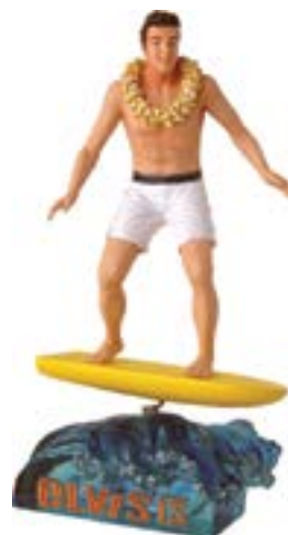
Elvis is... Westland. Figurine de tableau de bord SurfingMemory, coll. Gérard Decoster