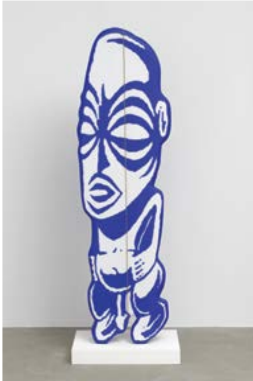
Sculpture surfable, Olivier Millagou

Une série de thèmes autour du surfwear, de la publicité, la musique, la bande dessinée, la littérature, les industries créatives, l'artisanat kitch et le tourisme.