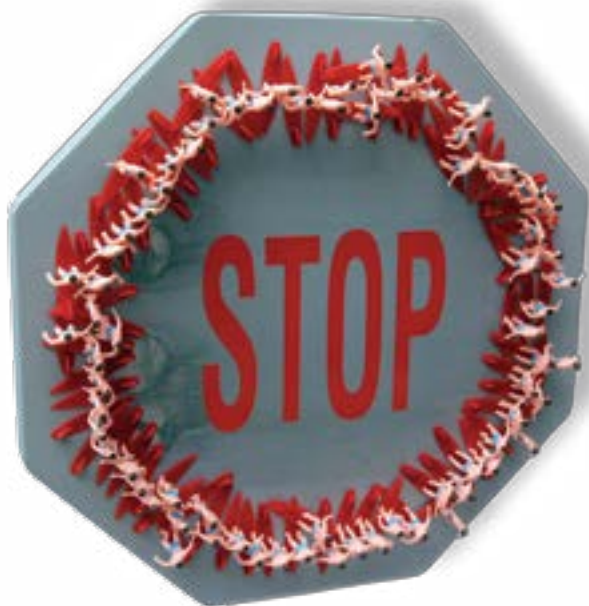
Stop. France. Gérard Decoster SurfingMemory, coll. Gérard Decoster

Le contexte environnemental est traité ici autour des questions de la pollution marine, de l'écologie, des innovations techniques, du recyclage et de la protection des surfeurs et de l'arrivée des piscines à vagues.