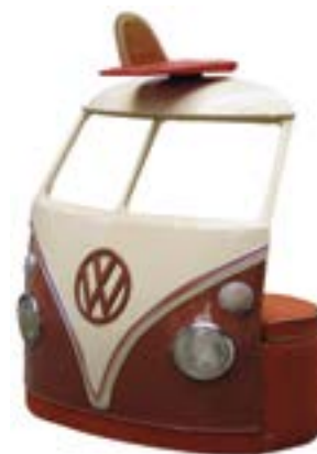
VW. Banquette Split. France. Thierry Courtade, 2008 SurfingMemory, coll. Gérard Decoster