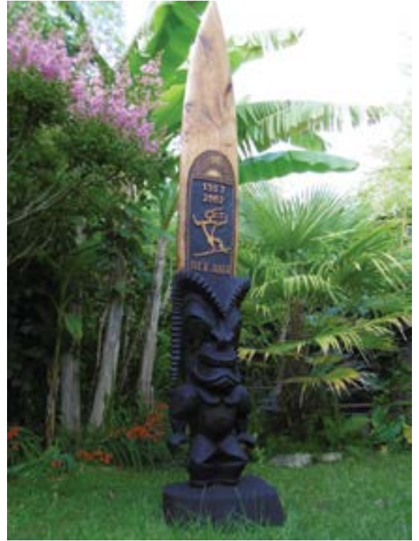
Tiki hawaïen. 50 ans de surf en France, Phil Totem