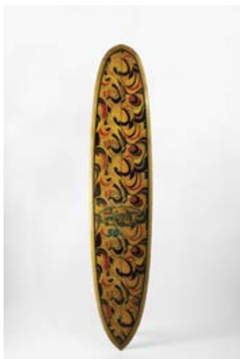
HANSEN 50/50 MODEL 1967-68. Rare « Pointed Tail » avec inclusion de tissus très Flower power. Symbolique de l'Acid génération