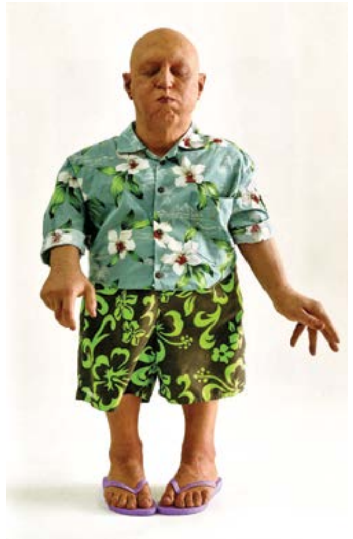
Pawn (Tities and beer), Résine, vêtements, accessoires peinture à l'huile 2011

Dans l'imaginaire californien et américain, Hawaii, propriété des États-Unis depuis 1898, a constitué une extension du rêve américain vers le paradis des îles. Par l'influence du mode de vie d'Hawaii sur celui de la Californie, celle-ci s'est elle-même transformée en image paradisiaque, le fameux Sunshine State .