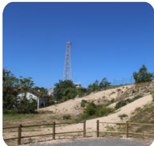
Le sémaphore militaire