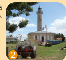
Phare de Richard à Jau-Dignac-et-Loirac.

Un topoguide à votre disposition pour découvrir Jau-Dignac-et-Loirac à pied. Disponible gratuitement auprès de l'Office de Tourisme.