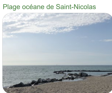
Plage océane de Saint-Nicolas