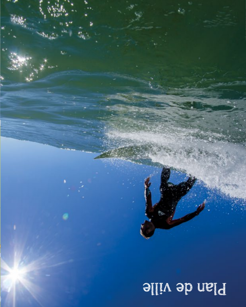
Plan de ville