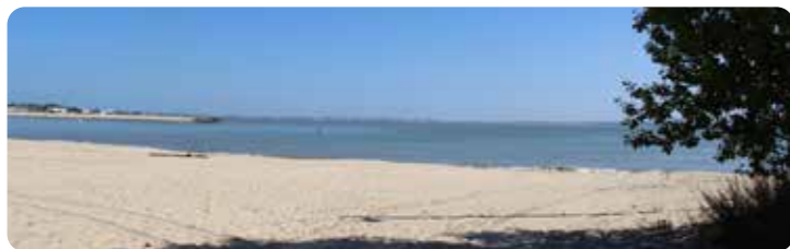
Plage estuarienne de La Chambrette Plage océane de Saint-Nicolas