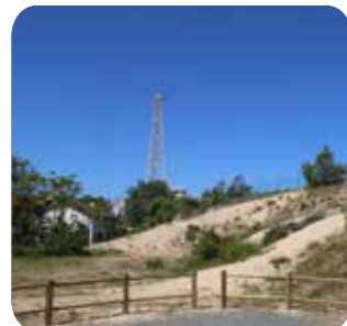
Le sémaphore militaire