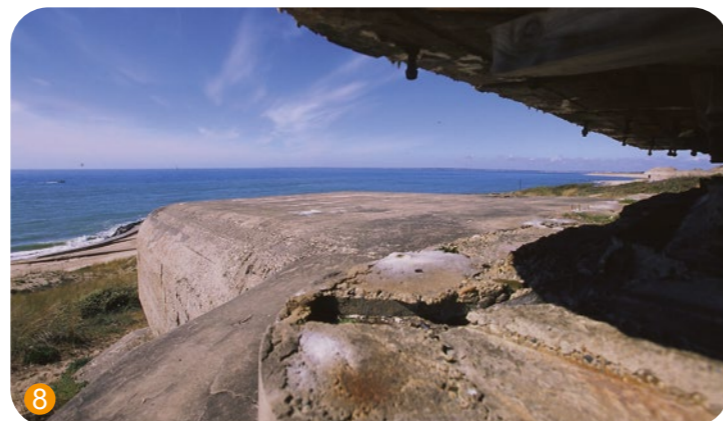
Une vue plongeante sur l'océan et le phare de Cordouan depuis le sommet d'un bunker allemand

Témoin important du style roman poitevin, cet édifice tel que nous le voyons aujourd'hui est le fruit d'une histoire mouvementée étroitement liée avec l'histoire de la station. Nous pouvons appréhender son histoire à travers quatre grandes périodes : une construction qui s'étend sur deux siècles, entre le XI e et le XII e ; une fortification dans le cadre des guerres de religion (en témoigne la tour quadrangulaire d'où résonnent les cloches aujourd'hui) ; une période continue d'ensablement entre le XIV e siècle et la moitié du XVIII e jusqu'à l'abandon total de l'édifice par les habitants et enfin une dernière période de "résurrection" lorsque la décision de la rendre au culte est prise au milieu du XIX e ... 220 000 m 3 de sable seront retirés mais la basilique ne sera jamais totalement libérée... Cette basilique est classée au Patrimoine Mondial de l'UNESCO depuis 1998 et Monument Historique depuis 1891.