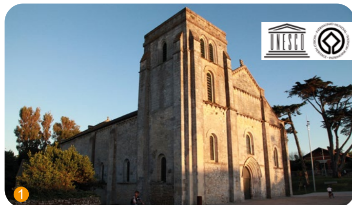
Une basilique classée au Patrimoine Mondial de l'UNESCO

Témoin important du style roman poitevin, cet édifice tel que nous le voyons aujourd'hui est le fruit d'une histoire mouvementée étroitement liée avec l'histoire de la station. Nous pouvons appréhender son histoire à travers quatre grandes périodes : une construction qui s'étend sur deux siècles, entre le XI e et le XII e ; une fortification dans le cadre des guerres de religion (en témoigne la tour quadrangulaire d'où résonnent les cloches aujourd'hui) ; une période continue d'ensablement entre le XIV e siècle et la moitié du XVIII e jusqu'à l'abandon total de l'édifice par les habitants et enfin une dernière période de "résurrection" lorsque la décision de la rendre au culte est prise au milieu du XIX e ... 220 000 m 3 de sable seront retirés mais la basilique ne sera jamais totalement libérée... Cette basilique est classée au Patrimoine Mondial de l'UNESCO depuis 1998 et Monument Historique depuis 1891.