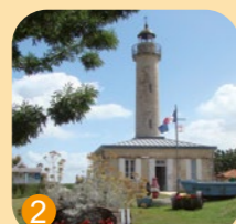
Phare de Richard à Jau-Dignac-et-Loirac