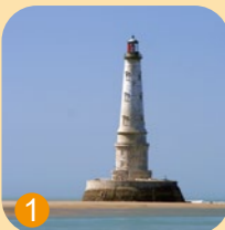
Phare de Cordouan le phare des rois et roi des phares, en pleine mer, mais parcelle n°1 du cadastre du Verdon sur Mer.