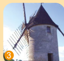
Moulin de Vensac

A ne pas manquer, le plus grand lac d'eau douce de France (Hourtin et Carcans), et les nombreux sentiers, balades et activités à découvrir.