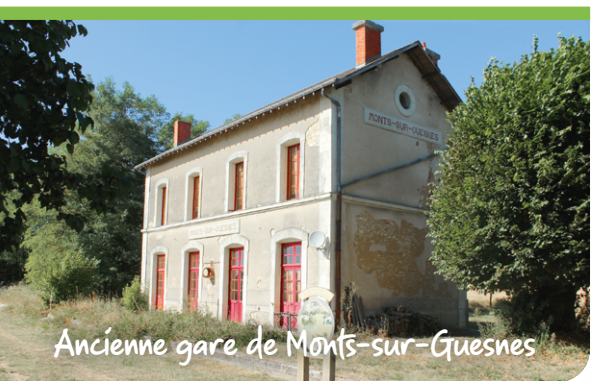
Ancienne gare de Monts-sur-Guesnes