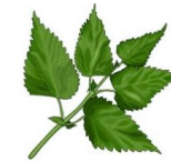
L'iris des marais