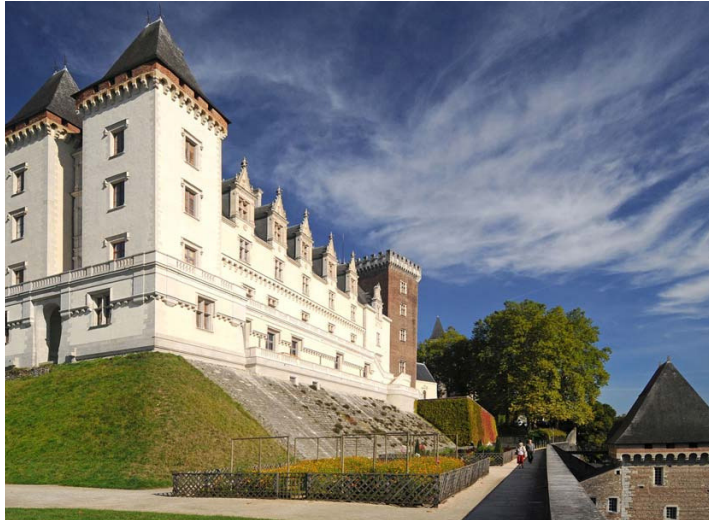
Traversez l'histoire au château d'Henri IV et à travers ses jardins