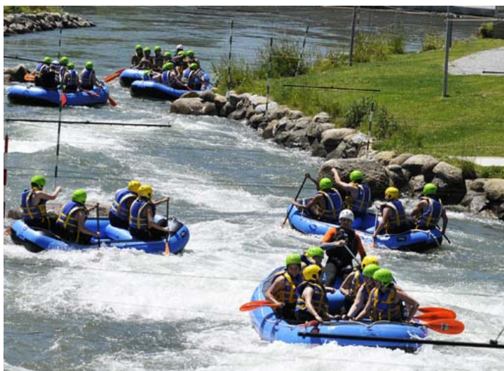
Suivez les traces de Tony Estanguet et affrontez la descente du Stade d'eaux vives