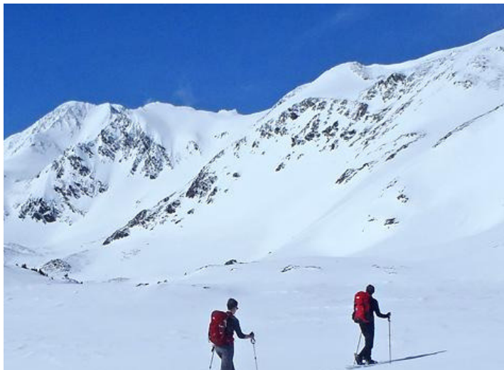
Marchez, skiez... respirez l'air frais des Pyrénées!