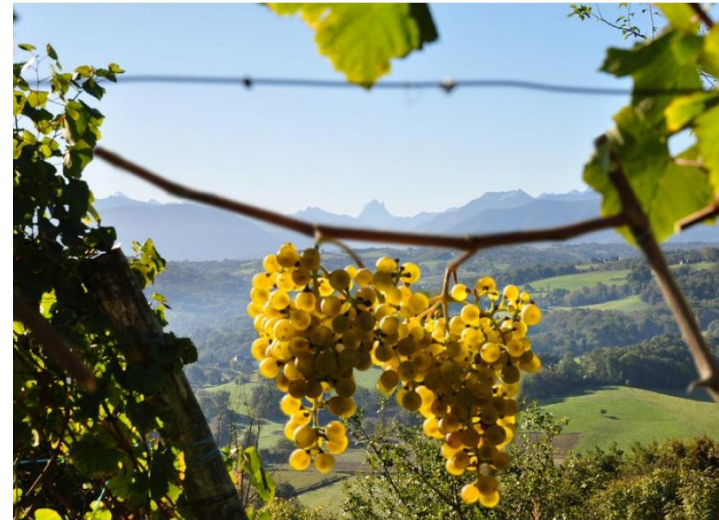
Dégustez les vins de Jurançon et de Madiran