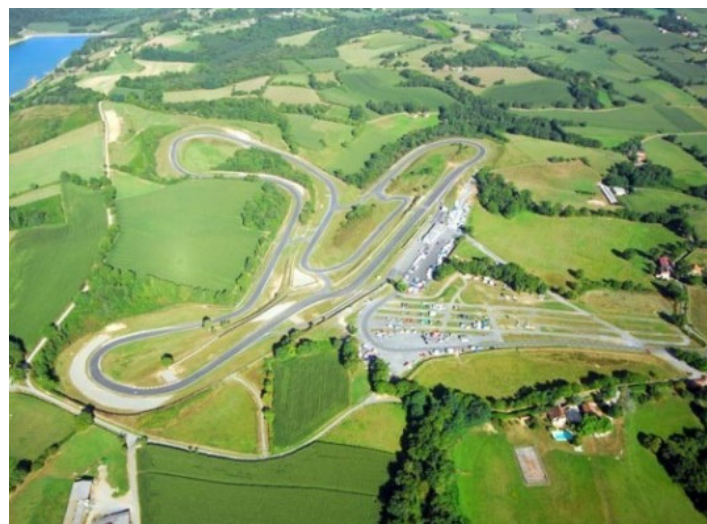
Vibrez au son des bolides du circuit Pau Arnos Conduite de F3, Porsche, Ferrari, Lamborghini...