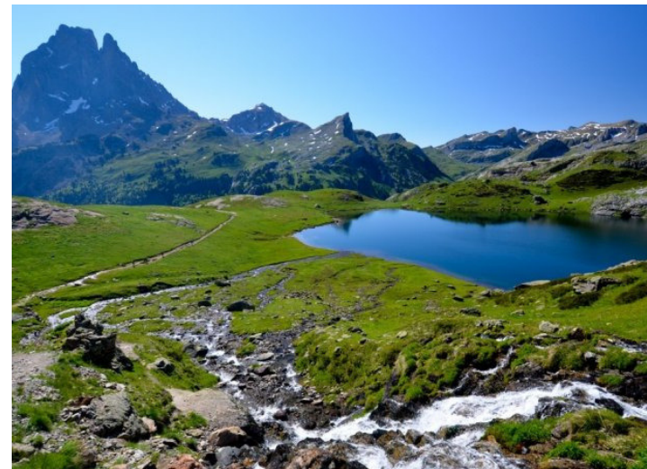
Evadez-vous et admirez les paysages et le bleu du ciel qui se reflète dans les lacs