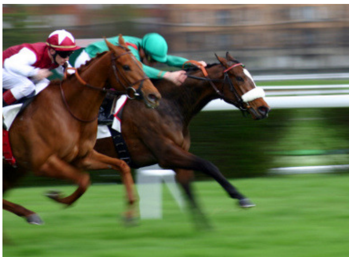
Entre courses à l'Hippodrome et Concours complet 4*unique en Europe, découvrez l'univers équin