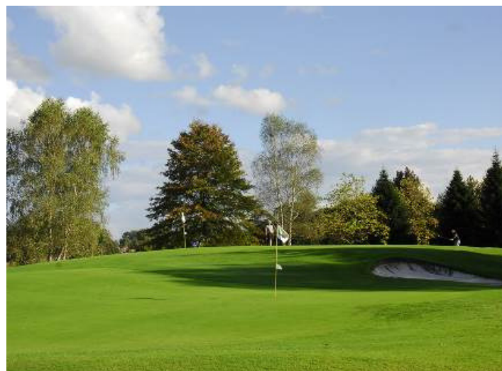
En pleine nature avec vue sur les Pyrénées, découvrez le Pau Golf Club de 1856