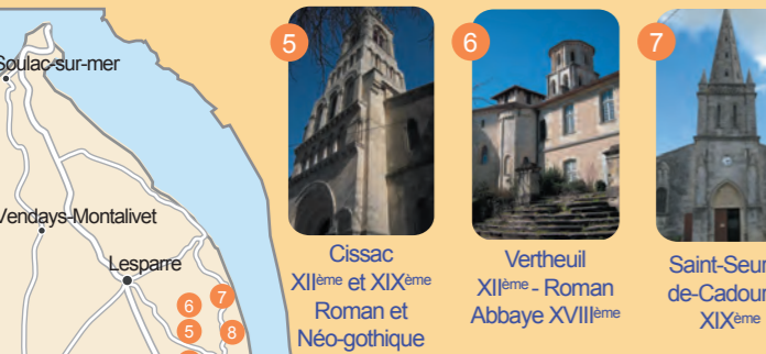
5 Cissac XII ème et XIX ème Roman et Néo-gothique 6 Vertheuil XI ème - Roman Abbaye XVIII ème 7 Saint-Seurin-de-Cadoume XIX ème