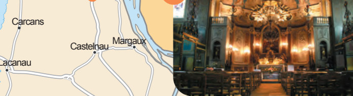
8 Saint-Estèphe XVIII ème - Baroque rococo