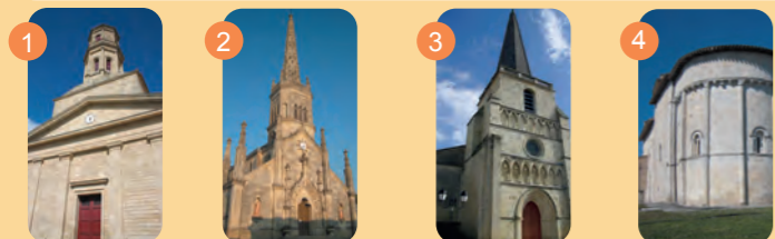
1 Pauillac XIX ème Néo-classique 2 Saint-Julien XIX ème Néo-gothique 3 Saint-Laurent XII ème - Roman et la chapelle de Benon 4 Saint-Sauveur XII ème - Roman