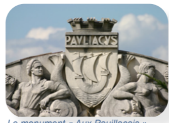
Le monument « Aux Pauillacais »

Si tu cherches bien, tu dois trouver le monument ci-dessous en photo.