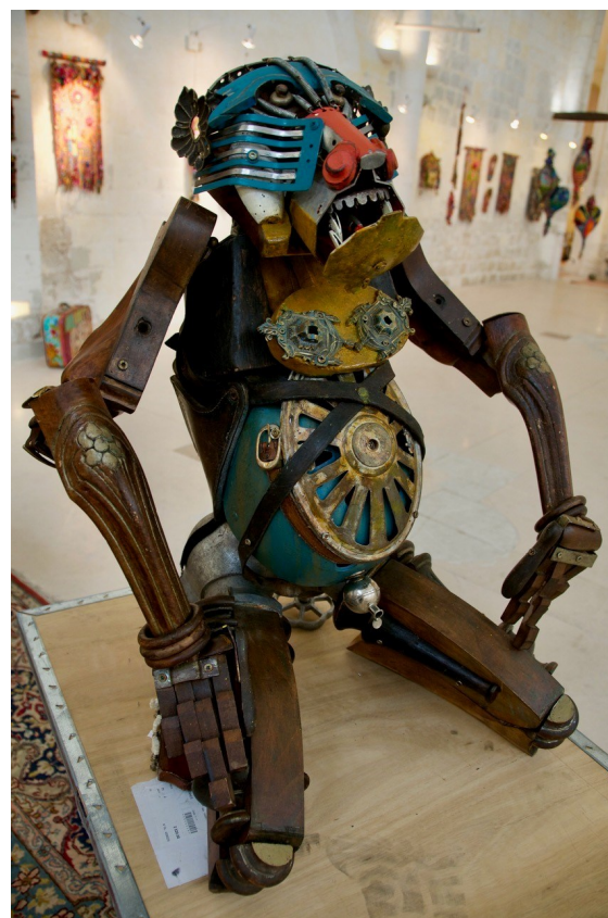
Œuvre de Stéphane MONTMAILLER, Hors Cadre 1

La Collégiale Sainte-Croix de Loudun se situe dans le département de la Vienne (86) entre Angers, Tours et Poitiers.