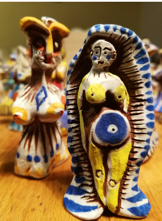
Poupées de terre Céramique, 10 x 3 cm, 2020

Vit et travaille à Camarsac en Gironde (33)