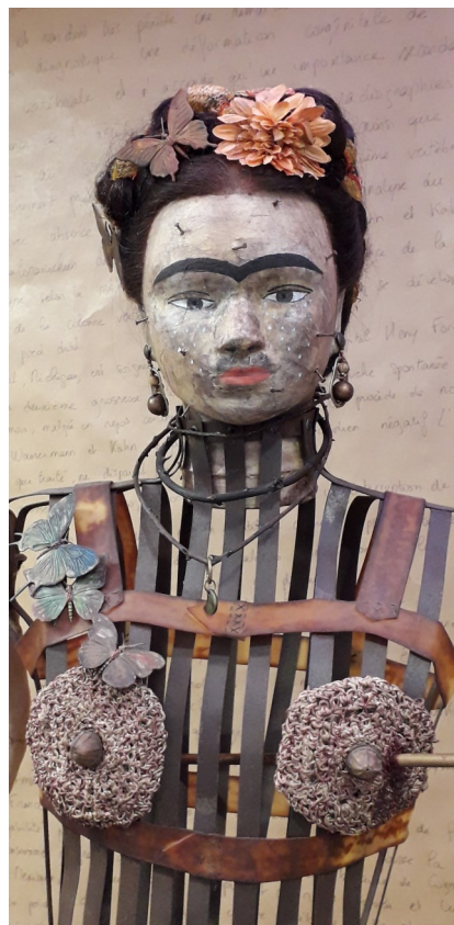
Ma Frida (détail) Assemblage, h : 160 cm, 2014

Vit et travaille à Albi dans le Tarn (81)