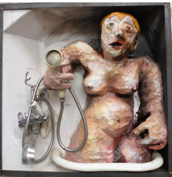
Femme au bain

Technique mixte (grillage, papier, colle, peinture, objets), 70 x 70 x 40 cm