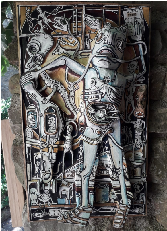
Solitaire, Dupont traine son bidon sur le trajet de ses ambitions Bas relief (maroufle, encre de Chine) 40 x 28 cm 1997