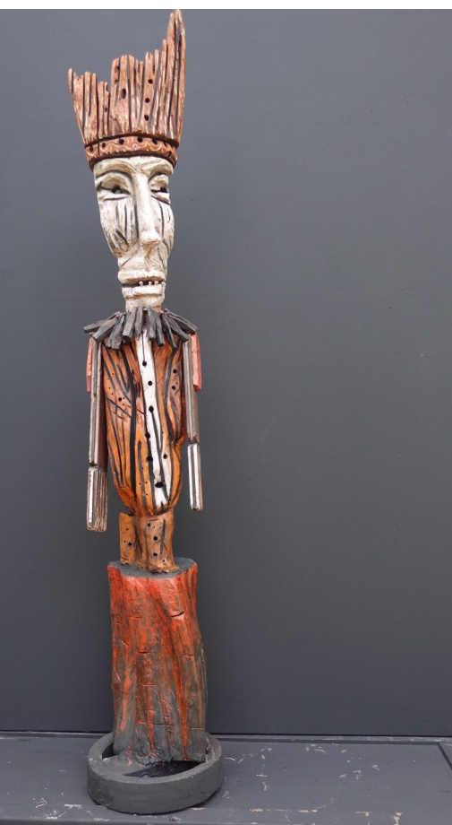
Esprit du bois d'Assenay