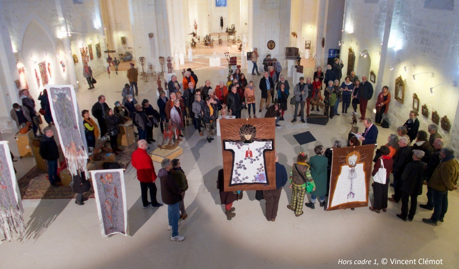
Hors cadre 1