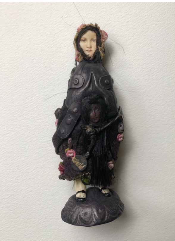
Poupée en mal d'enfantement n°590 bis Technique mixte (tissus, céramique, médaille, broderie, chromo), 14 x 5 cm

Vit et travaille à Saint-Laurent du Pont dans l'Isère (38)