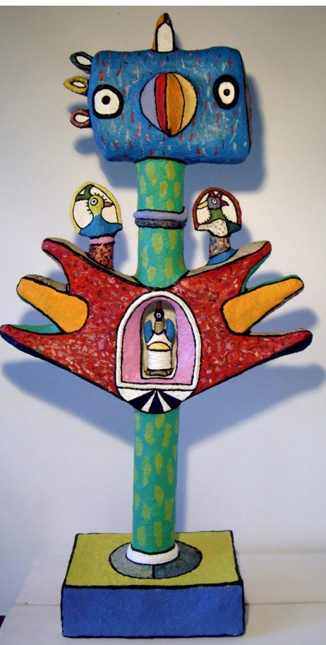
Grand oiseau à tête bleue Papier maché et peinture, 148 x 75 cm

Vit et travaille à Carrières-sur-Seine dans les Yvelines (78)