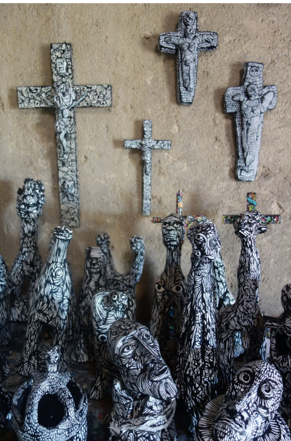
Personnages et Crucifix

Encre de chine et acrylique sur terre cuite, environ 25 cm