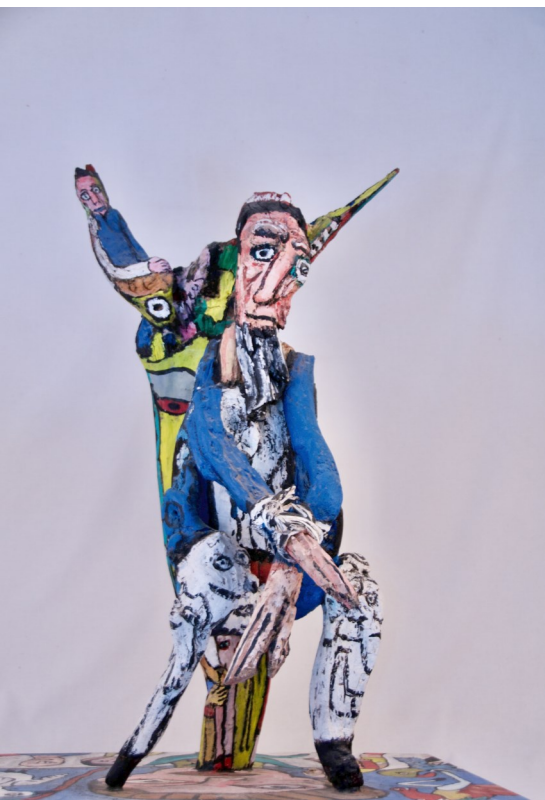
Pas de quoi plastronner