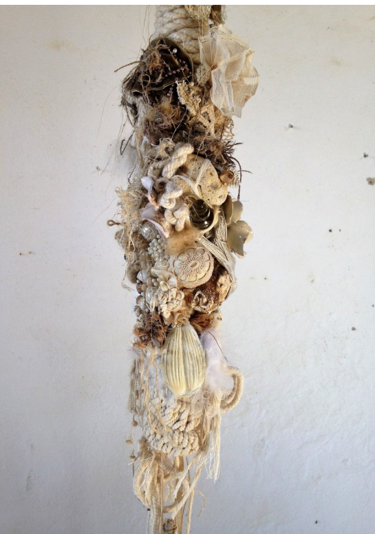
Tisser les os de la vie (détail)