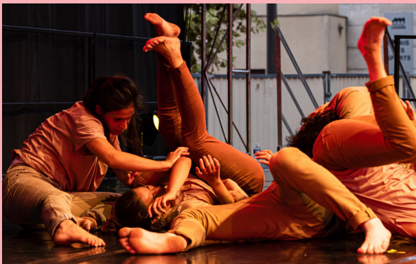
15 ème traces contemporaines

Autres dates à venir.... sur www.espacedantza.com